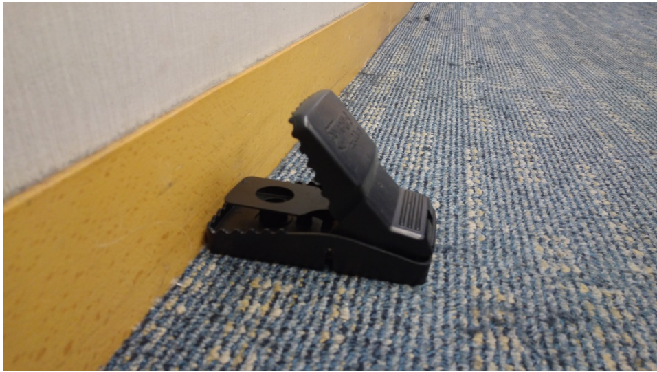
圖 2 鼠夾樣品