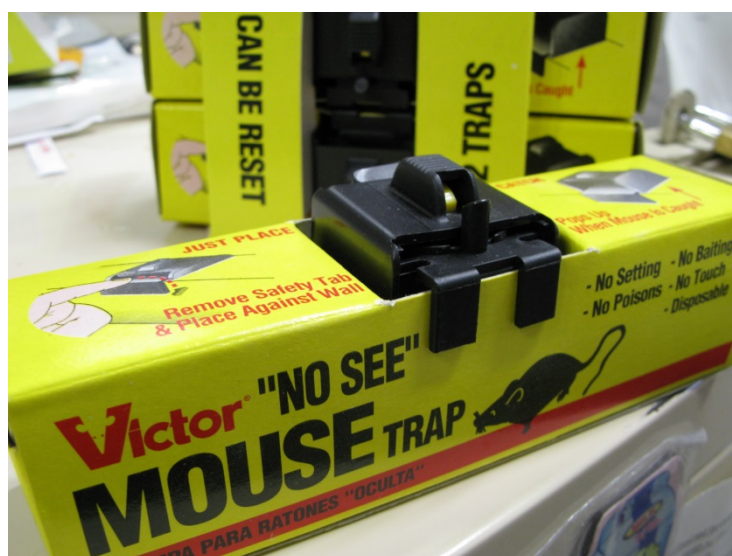
圖 1 新型鼠夾

蟲鼠管理業界採用誘捕方法滅鼠已是大勢所趨，原因是市民大眾要求以非化學方法防治蟲鼠，而對大多數商業機構和住戶來說，這些捕鼠器具成本效益，已能滿足日常監控輕微鼠患的需要。