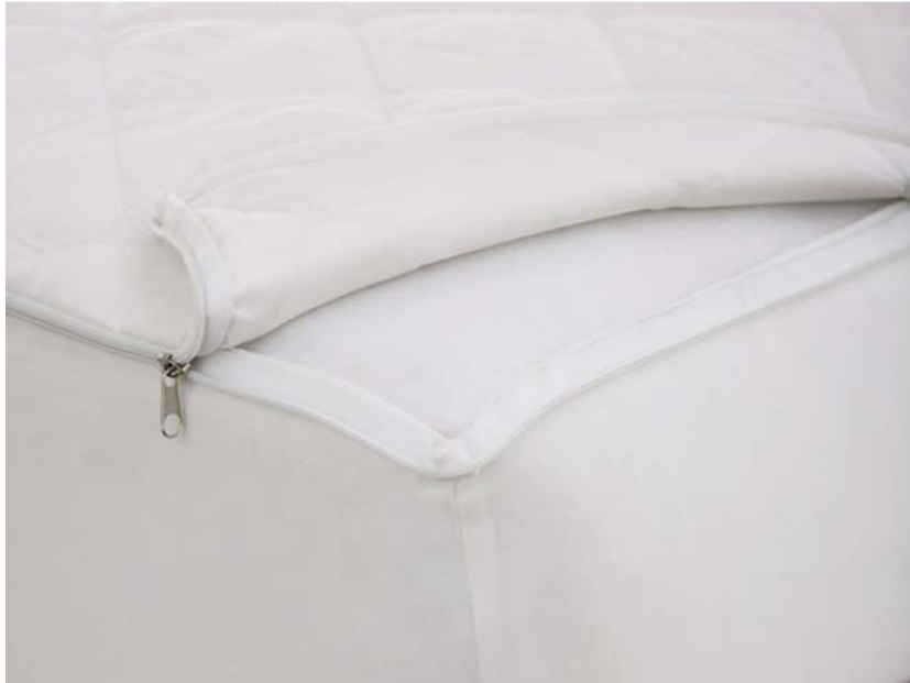
在床褥套上蓋上可清洗的床褥墊可避免弄污床褥套