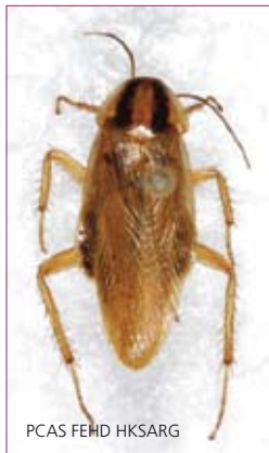
PCAS FEHD HKSARG