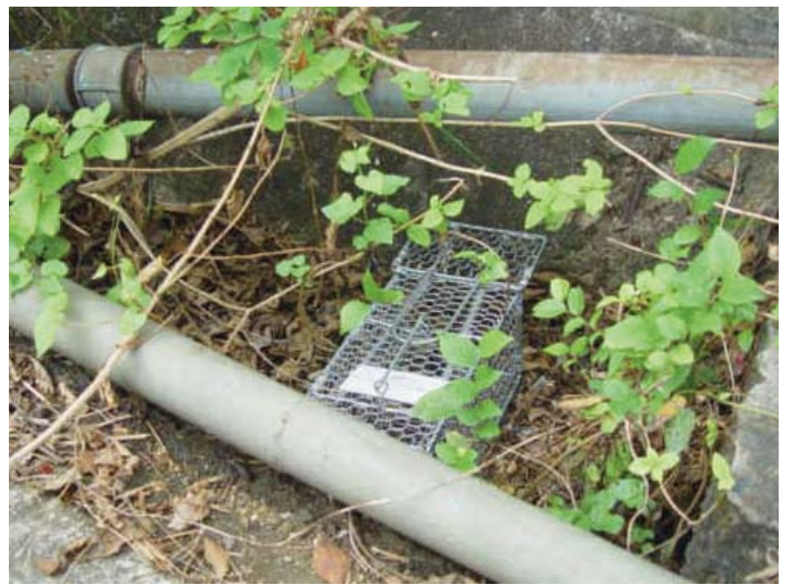
使用誘捕法進行鼠蚤調查 (食環署防治蟲鼠事務諮詢組)