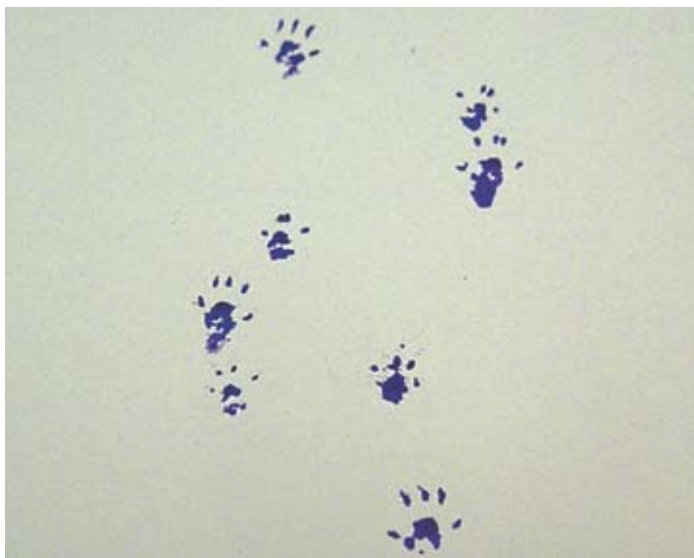
小家鼠的足印 (食環署防治蟲鼠事務諮詢組)