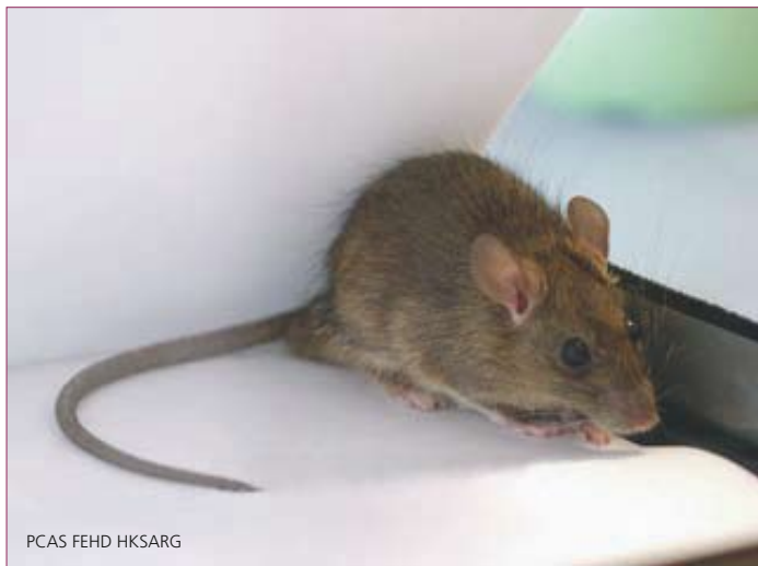
PCAS FEHD HKSARG

蟑螂躲在隱蔽的地方，在茶水間、縫隙、抽屜及貯物室出沒。蟑螂及其排泄物會令人產生過敏反應，牠們損毀食物及文件，同時也會傳播疾病。