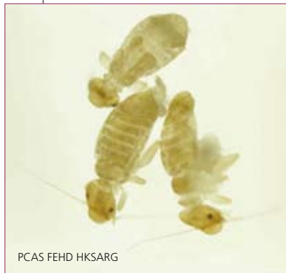
PCAS FEHD HKSARG