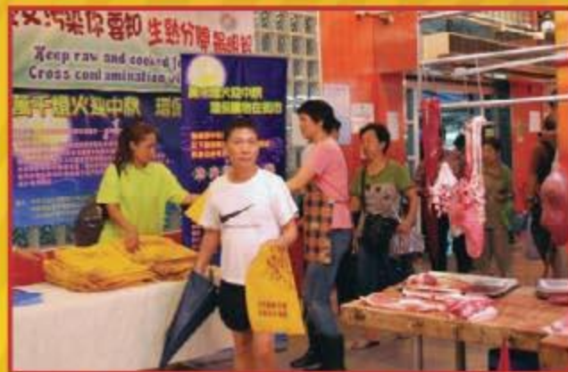
▲ 工作人員向市民派發環保袋