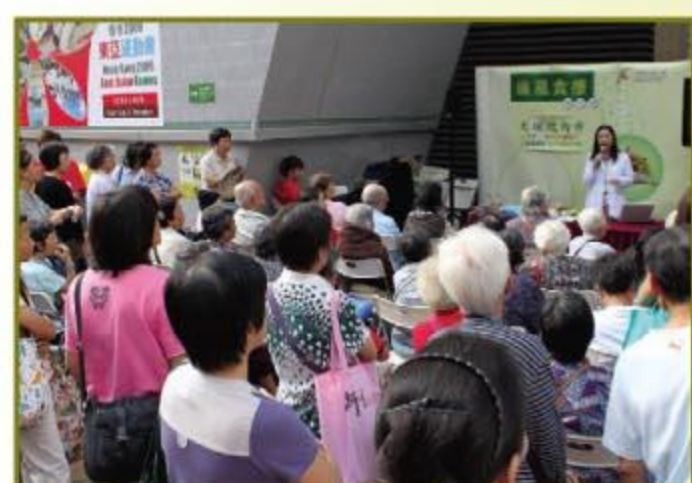
▲ 市民專注中醫師講解

我們於2009年11月3日至12月4日所舉辦“痛風食療工作坊”已經圓滿結束。市民反應非常熱烈，謹此多謝大家踴躍支持。