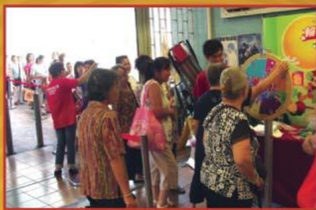
▲ 市民排隊轉動幸運輪，贏取獎品