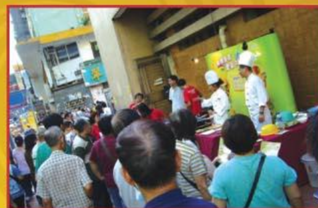
▲ 市民留心觀看烹飪示範