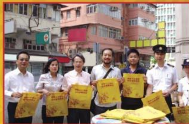
▲ 食環署職員一同派發環保袋