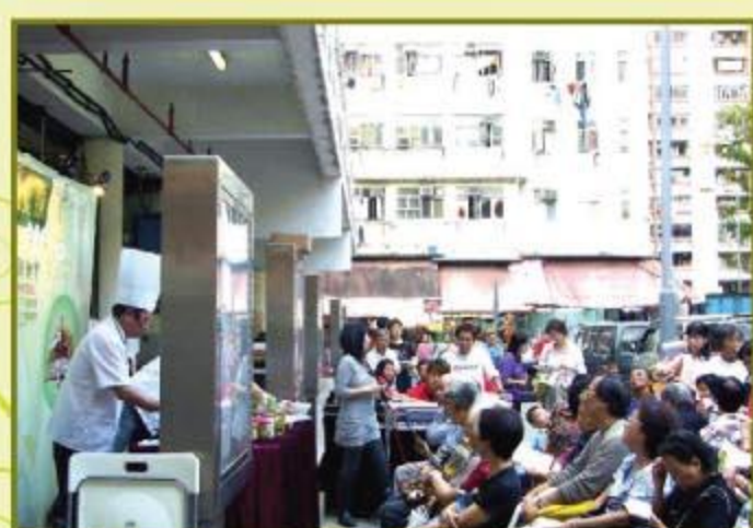
▲ 市民忙於紀錄烹飪導師的煮食秘訣