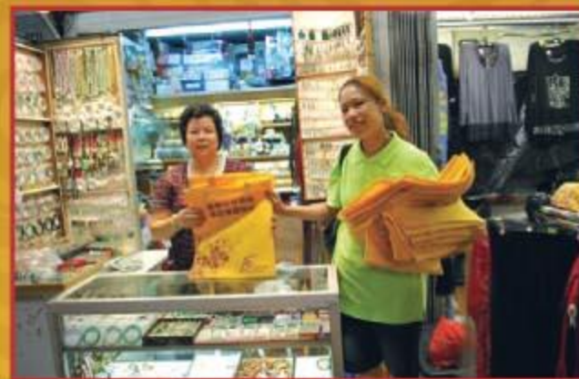
▲ 工作人員向檔戶派發環保袋