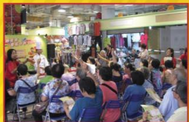
▲ 市民熱烈參與答問環節