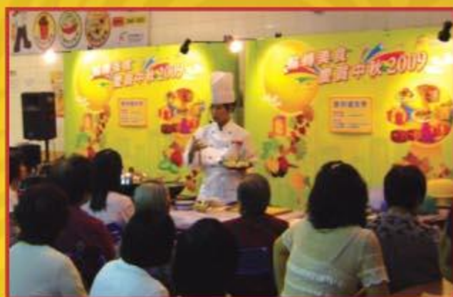
▲ 烹飪導師耐心講解烹飪心得