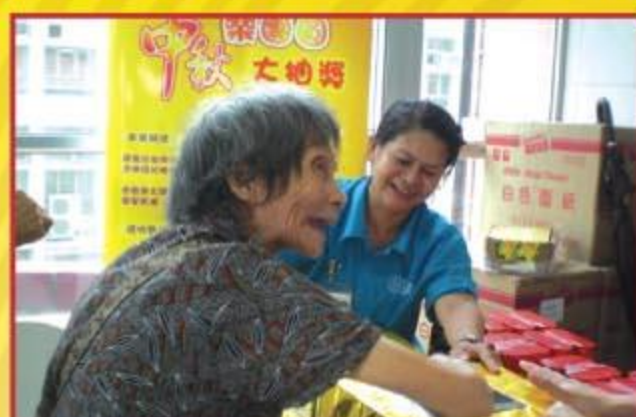
▲ 市民投入參與抽獎遊戲