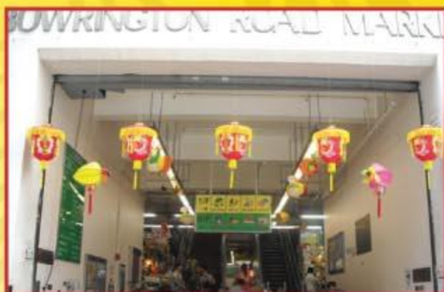
▲ 這些裝飾為街市增添不少節日氣氛