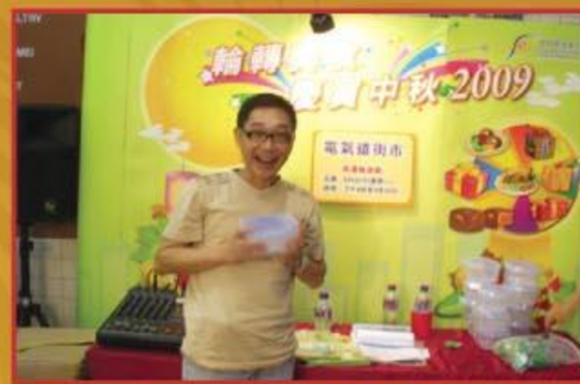
▲ 市民興奮地展示贏得的獎品