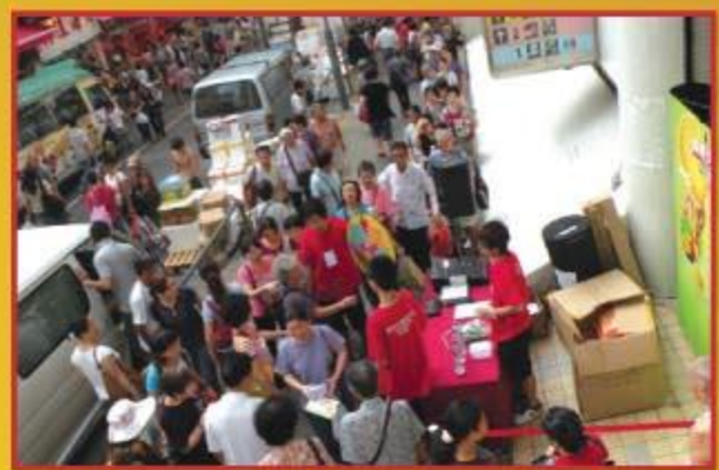
▲ 市民踴躍參加，氣氛熱鬧