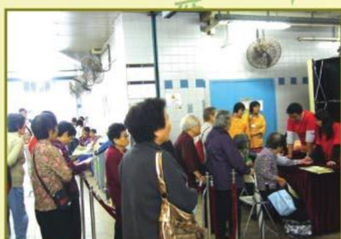
▲ 市民有秩序地排隊量度血壓