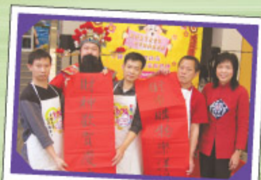
商戶都穿上整潔的圍裙，迎接財神的到賀

為提升公眾街市的形象及使街市更為整潔，於去年底，我們製作了印有“歡迎光臨公眾街市”標語的圍裙，贈予所有公眾街市的商戶。我們鼓勵商戶於工作期間穿著該圍裙，並保持圍裙清潔，以提升街市整體的形象，令顧客更樂於前來購物。市民下次光臨街市時，不妨留意一下！