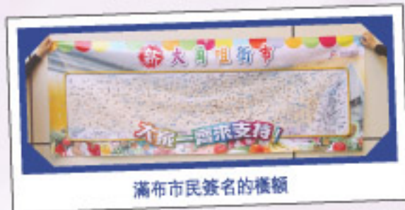
滿布市民簽名的橫額