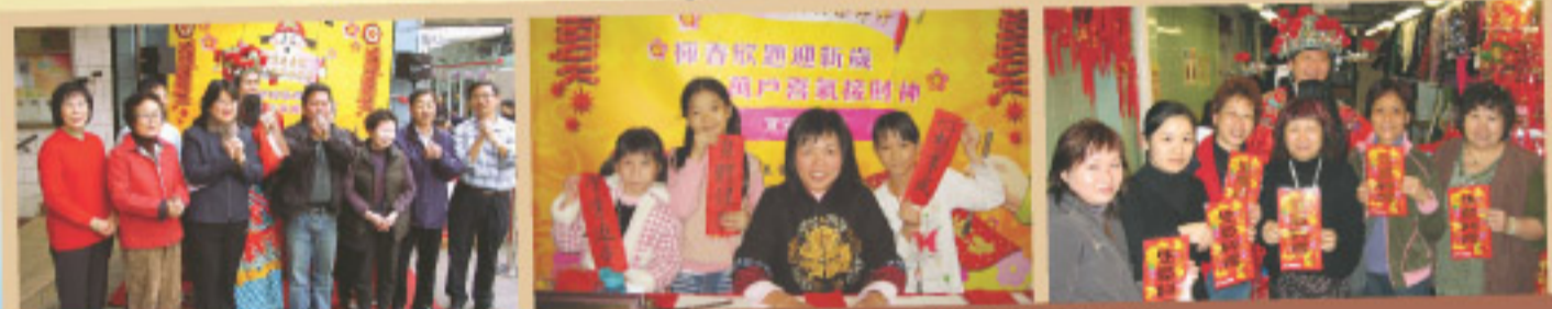
商戶及市民高興地從財神及書法導師手中接過新春對聯及揮春