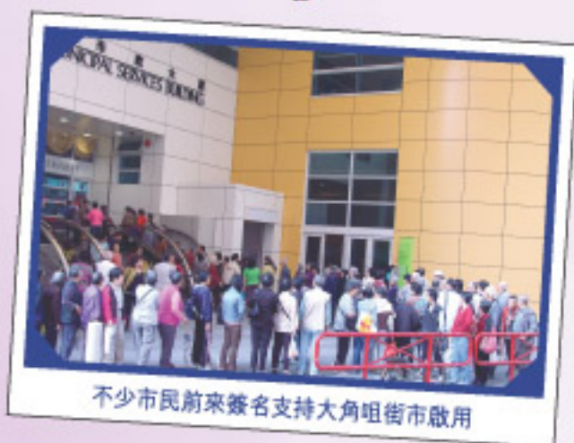
不少市民前來簽名支持大角咀街市啟用

推廣活動一浪接一浪，我們於一月二十日至二月十日期間，舉辦了「考眼光 贏『福』袋」新春推廣活動，競猜大角咀街市宣傳牌上的食物總價值，估中或估值最接近答案的三十名參加者，即可贏取「福」袋一個，內有約值二百元的廚房用品。得獎名單已在大角咀街市公告箱及我們的網頁公布。謹此多謝市民踴躍支持！