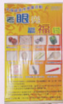
「考眼光 贏『福』袋」宣傳牌