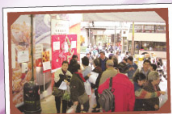
石塘咀街市：市民踴躍換領精美月曆或利是封

凡於上述日期到香港仔街市購物，可獲商戶派發印花，集齊印花，可換取擦擦咭一張，有機會贏取不同的禮品。詳情將在香港仔街市公告箱及我們的網頁公布。大家記得留意，千萬不要錯過呀！