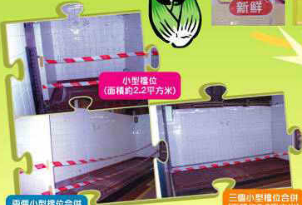
小型檔位 (面積約2.2平方米)