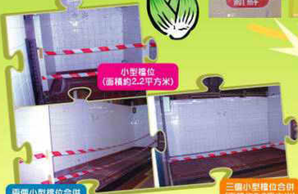
小型檔位 (面積約2.2平方米)