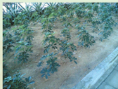
圖6.21 種植向上生長的植物方便察看泥土表面