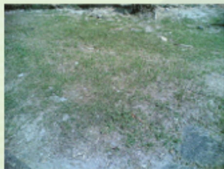
圖6.20 修剪整齊的花床

定期修剪花床和花園，令泥土不被植物覆蓋，老鼠難以挖洞。這也方便查看花床和花園是否有鼠洞及垃圾堆積。避免種植匍匐植物。種植向上生長及枝葉較為疏落的植物，以方便察看泥土表面。