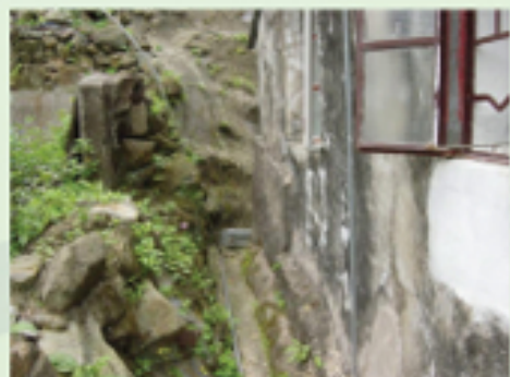
圖6.23 房舍四周沒有濃密草木和堆積的物品

老鼠不愛在露天地地方走動。清除房舍四周的物品可防止老鼠在房舍附近藏匿，也令環境不利老鼠活動。