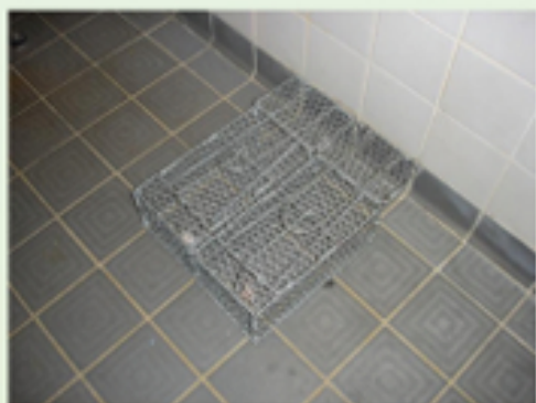
圖6.26(左) 兩個鼠籠放在同一個位置