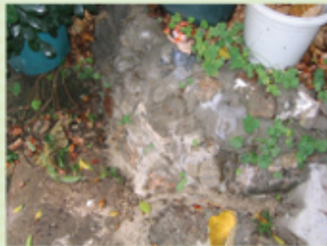
圖6.22 石塊間的縫隙已封好。