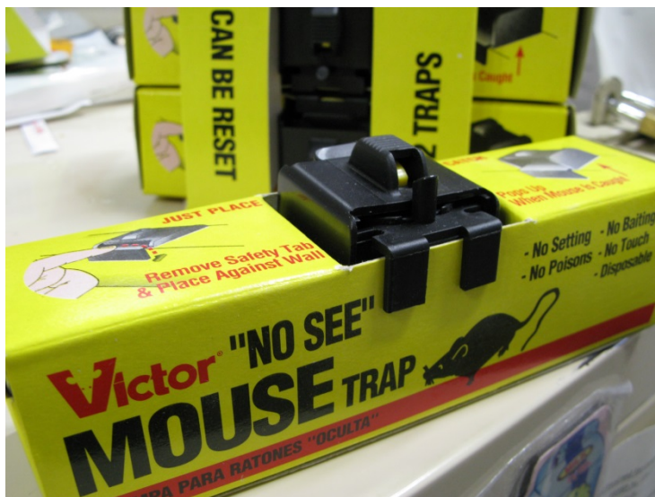
图 1 新型鼠夹

虫鼠管理业界采用诱捕方法灭鼠已是大势所趋,原因是市民大众要求以非化学方法防治虫鼠,而对大多数商业机构和住户来说,这些捕鼠器具成本效益,已能满足日常监控轻微鼠患的需要。