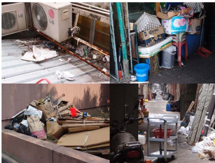
图 1 恶劣的环境卫生为老鼠提供食物及栖息地

控鼠方法的选择很有限，有时更需要同时使用不同方法。要有效对付鼠患，操作员要确保控制工作有周详计划，及妥善执行。