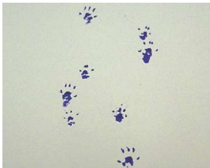
小家鼠的足印 (食环署防治虫鼠事务咨询组)