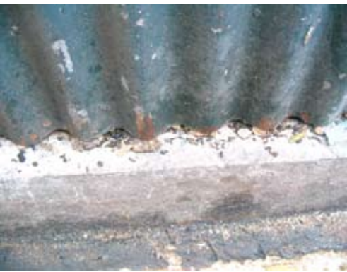
沟鼠的粪便 (食环署防治虫鼠事务咨询组)

由于鼠只通常在晚上活动，在日间我们只能观察鼠患迹象，以追踪鼠只的活动情况。视察人员必须具备侦视鼠患迹象的知识和技巧。除看见活鼠或鼠尸外，鼠粪也是显示目前或最近是否有老鼠出没的重要线索。