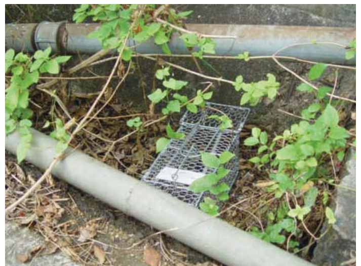
使用诱捕法进行鼠蚤调查 (食环署防治虫鼠事务咨询组)

或在户外发现一条光滑而沿路植物曾被践踏的小道；又或发现带有其他鼠患迹象的小道，这些都是鼠道的特徵。鼠尿在紫外光照射下会发出萤光，我们因此可在某些情况下凭鼠尿侦察老鼠的活动情况。