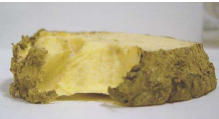
鼠只咬过的鼠饵 (食环署防治虫鼠事务咨询组)