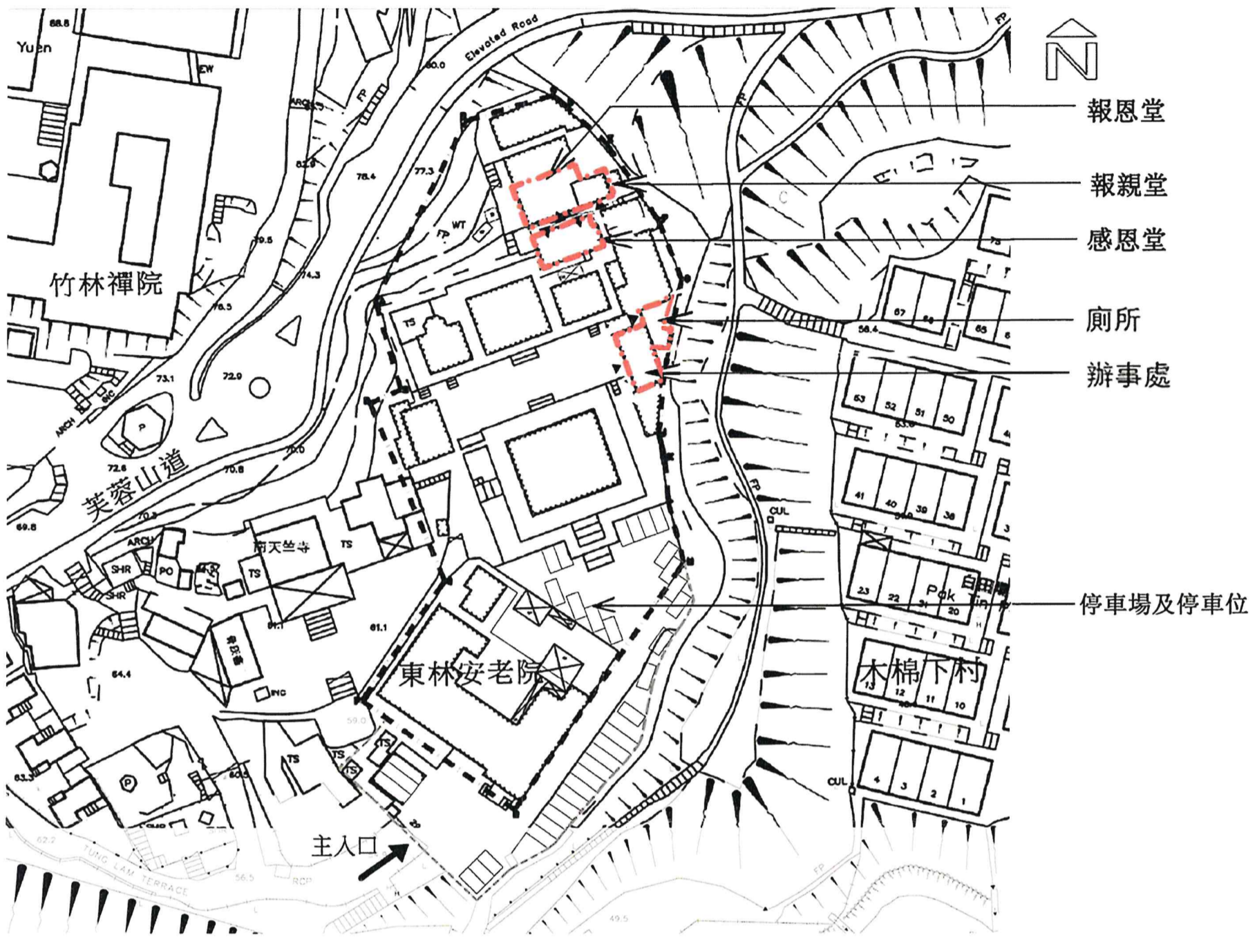
建議場地平面圖 (1:1000) (圖則編號001)