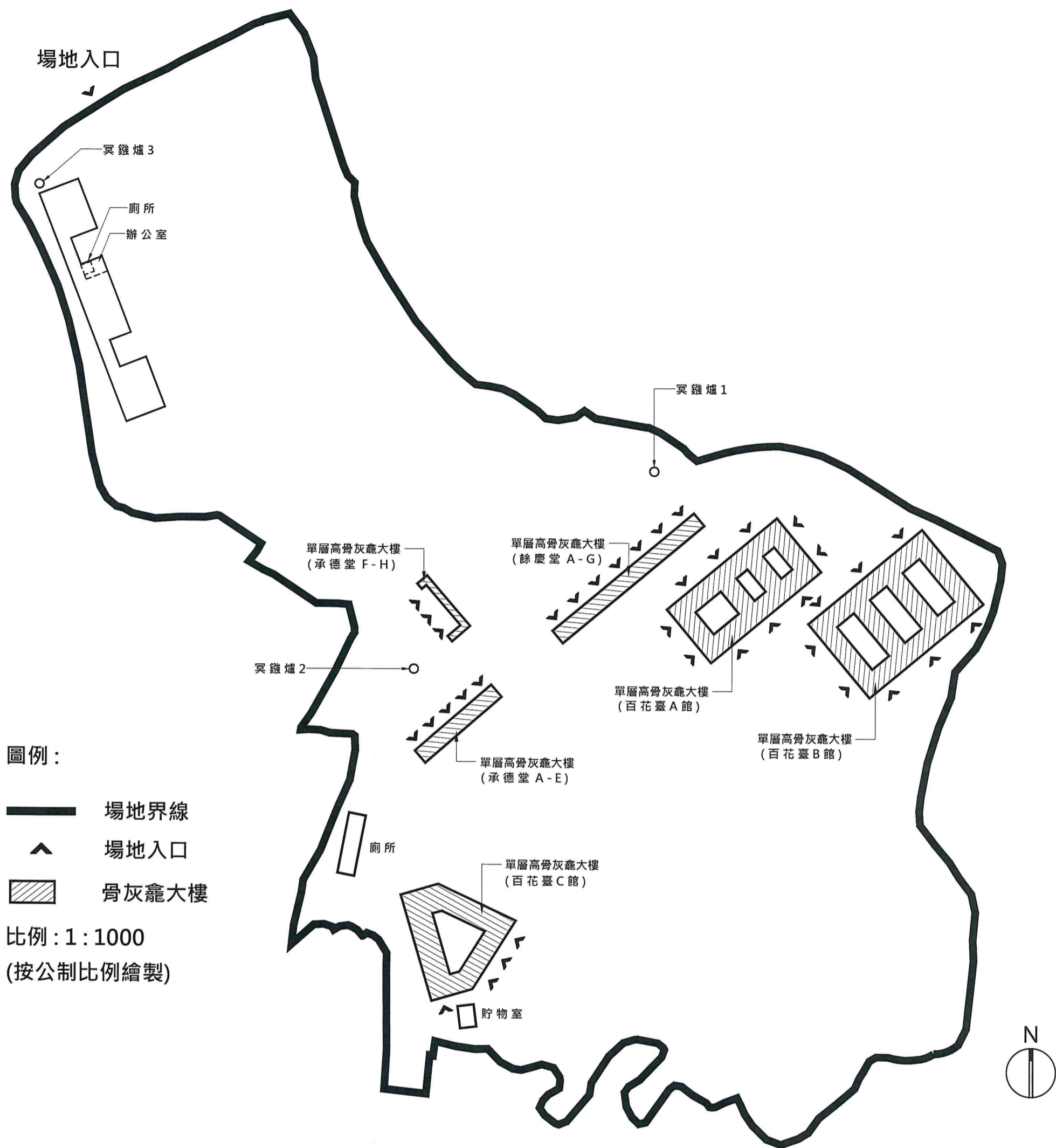
建議布局圖 (圖則編號 L-002)