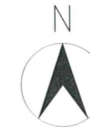
建議場地平面圖 (圖則編號 001)