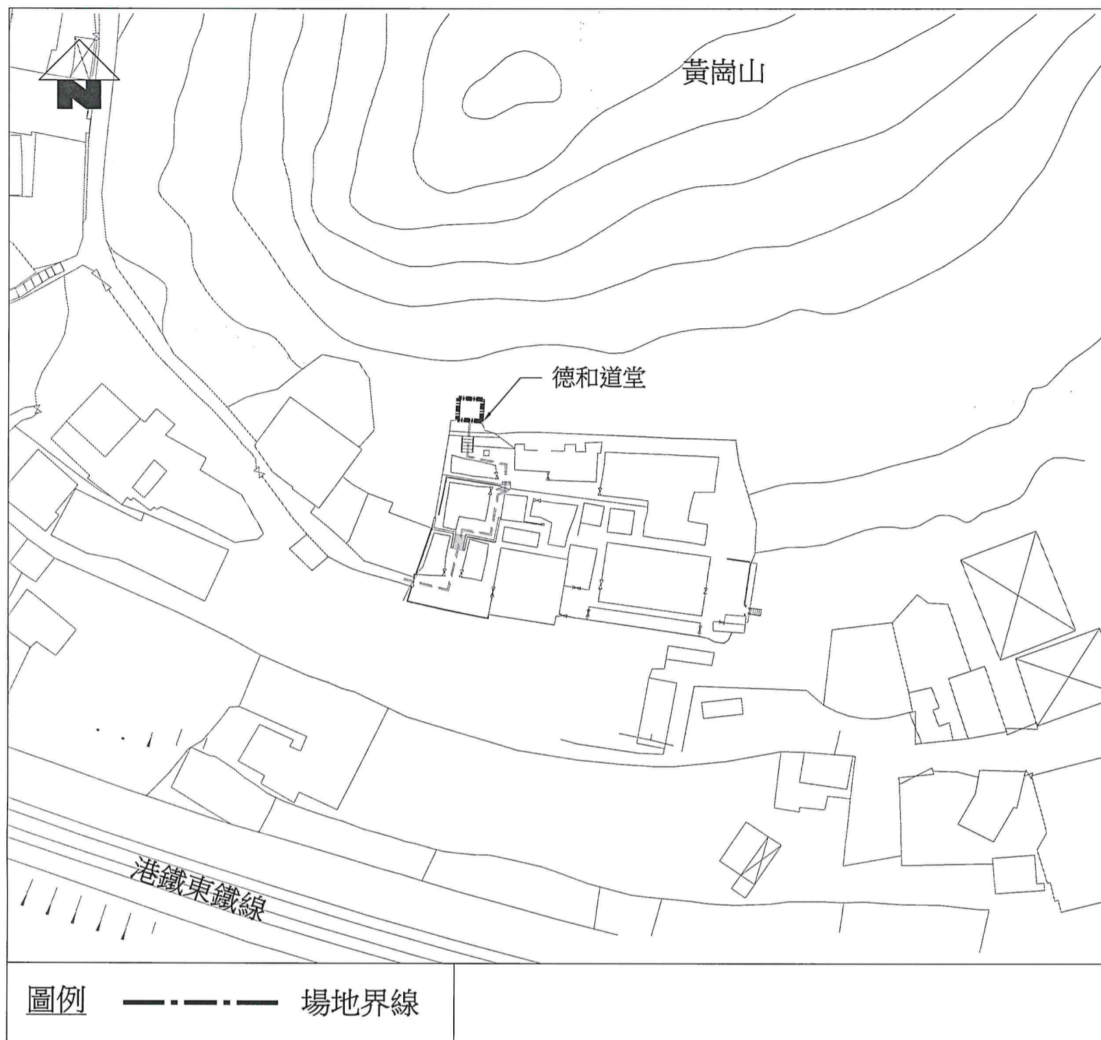
建議場地平面圖 (圖則編號 S1143-1)