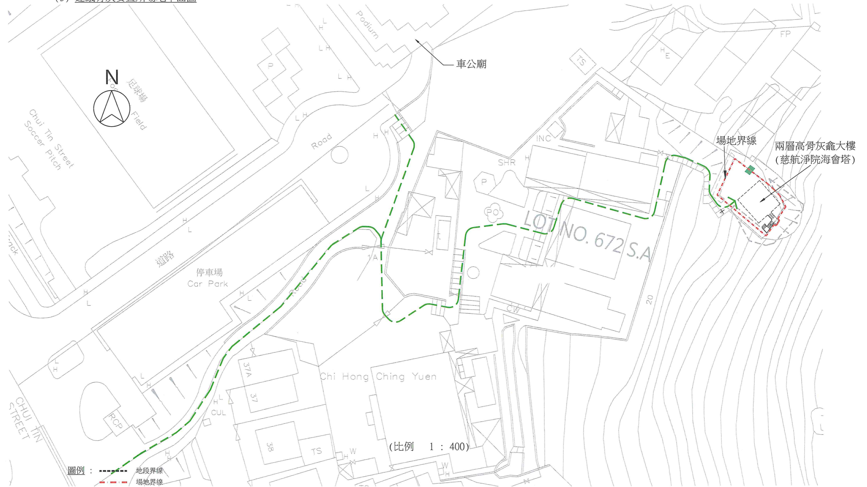
建議場地平面圖(圖則編號D-01)

骨灰安置所名稱： 慈航淨院海會塔 地址： 新界大圍新田村1號A慈航淨院(丈量約份第179約地段672號A分段)