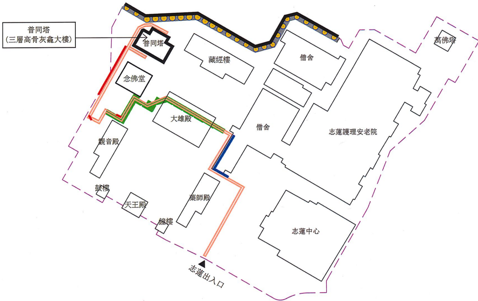
比例 1:1000 (按公制比例繪製) 建議場地布局圖 (圖則編號-002)