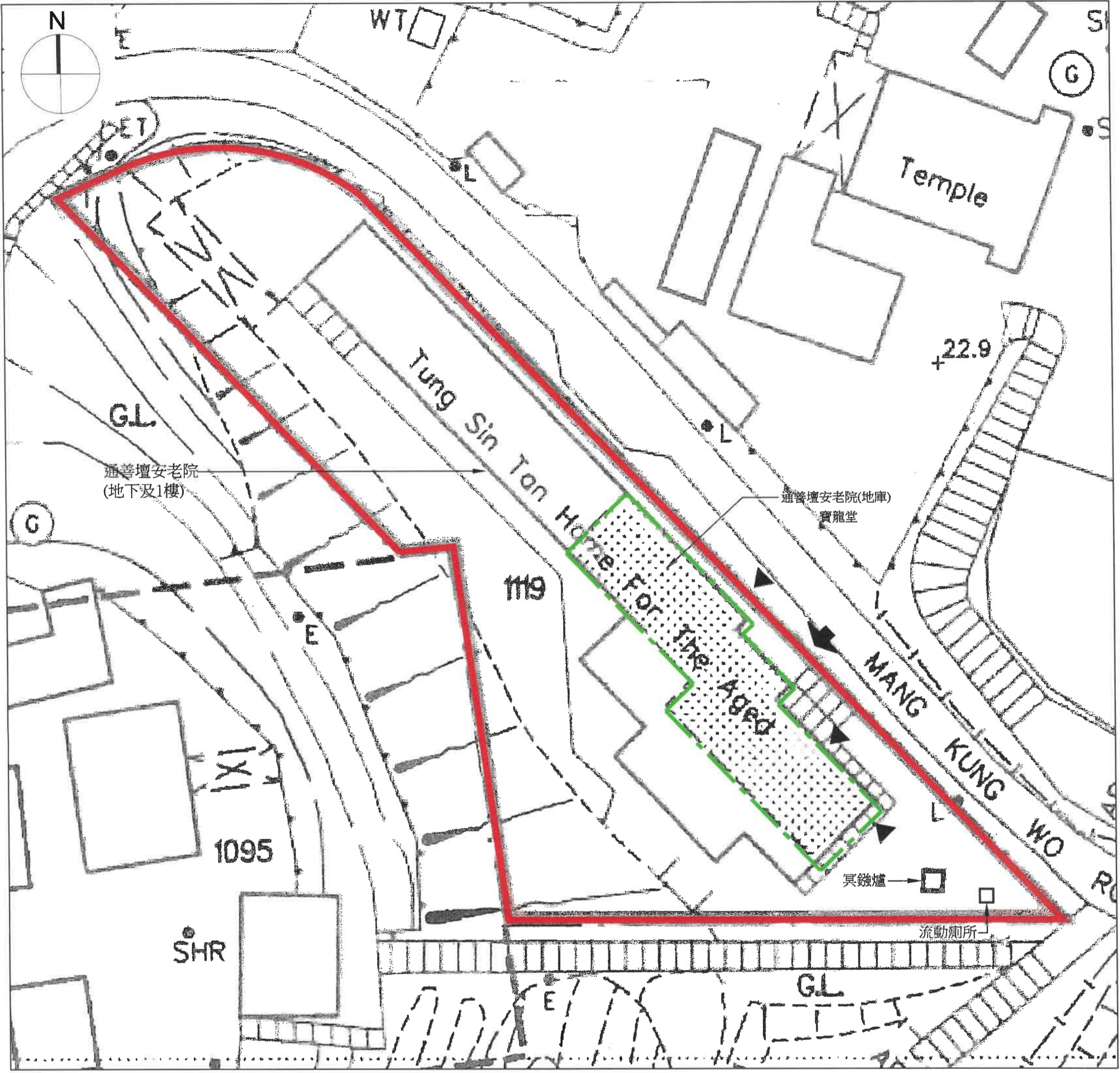
(比例1:300) 建議布局圖 (圖則編號E2)

骨灰安置所名稱：寶龍堂 地址：新界西貢大涌口白沙台孟公窩路通善壇安老院地庫 (丈量約份第217約地段第1119號)