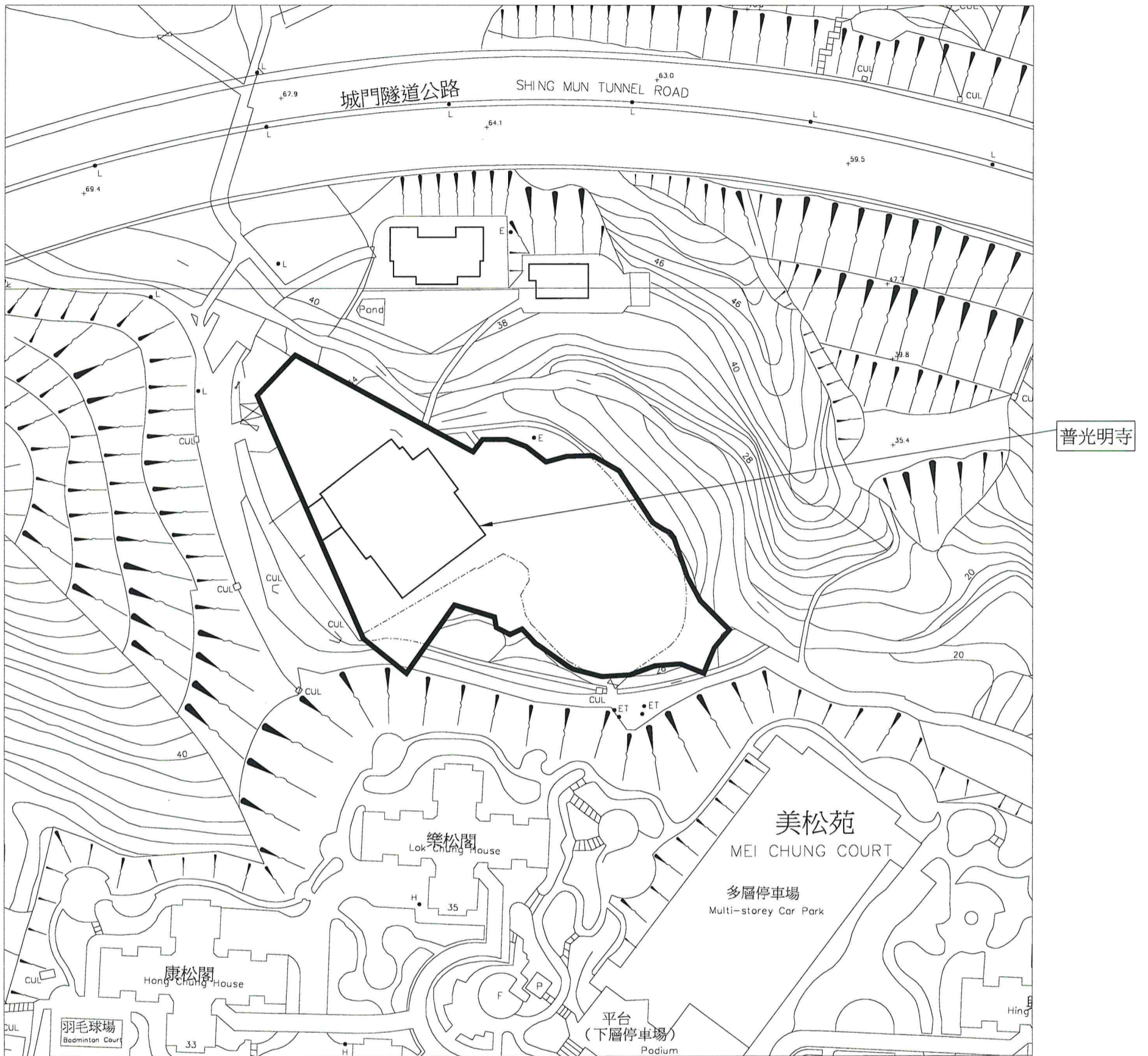
(按公制比例繪製) 建議場地平面圖 (圖則編號 001)