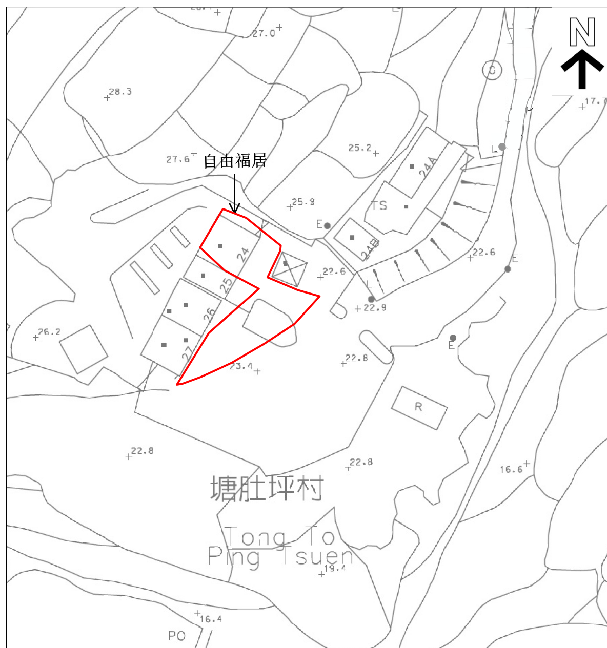
(按公制比例繪製)1:1000 建議場地平面圖 (圖則編號001)