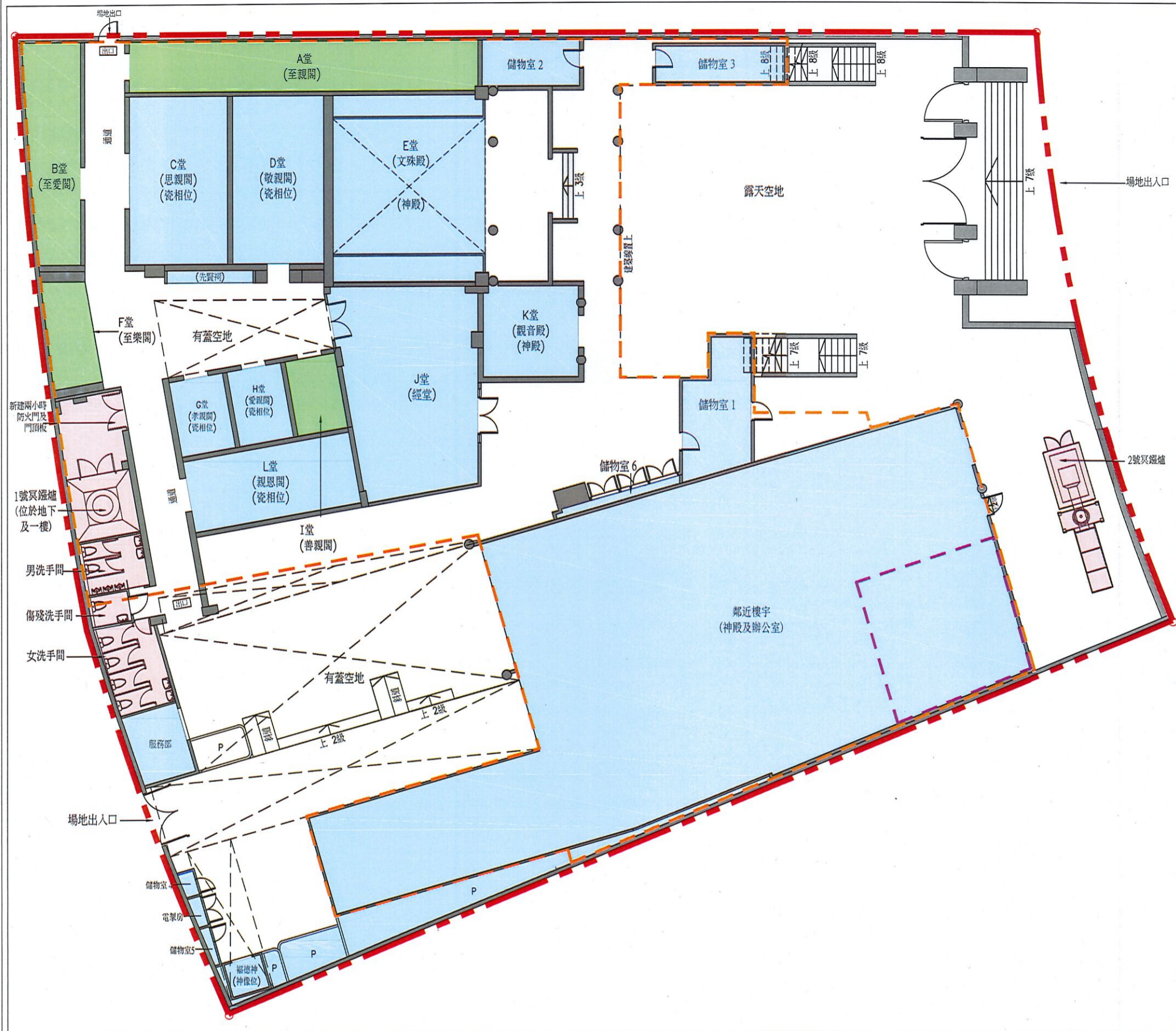
1 建議布局圖 比例: 1:200 (按公制比例繪製) (圖則編號: LP002)