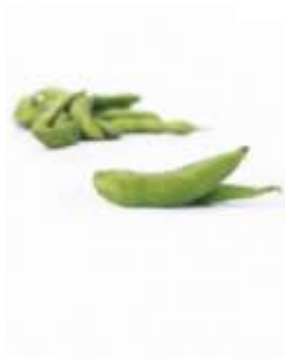
Green soybean 青 ceng1 毛 mou4 豆 dau6