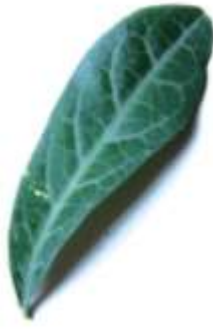
Dragon's tongue leaf 龍 lung4 脰 lei6 葉 jip6