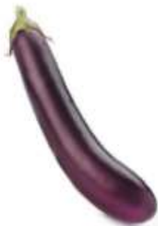
Eggplant 矮 ai2 瓜 gwaa1 (another name 又稱： 茄 ke4 子 zi2)