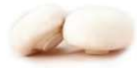
Button mushroom 磨 mo4 菇 gu1