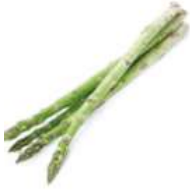
Asparagus 蘆 lou4 筍 seon2