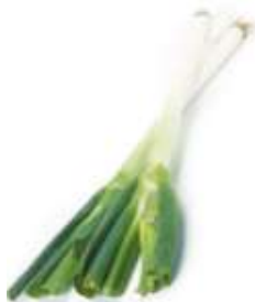
Green scallion 京 ging1 蔥 cung1