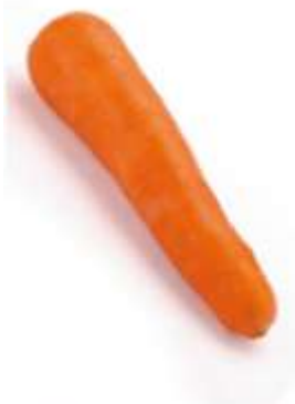
Carrot 甘 gam1 筍 seon2

圖中為白蘿蔔 The picture shows as white radish