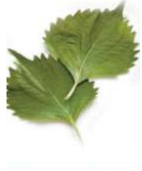
Perilla leaf 紫 zi2 蘇 sou1 葉 jip6