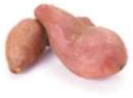
Sweet Potato 番 faan1 薯 syu4