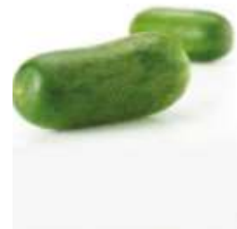
Hairy gourd 節 zit3 瓜 gwaa1 (another name 又稱： 毛 mou4 瓜 gwaa1)