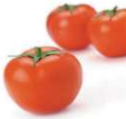
Tomato 番 faan1 茄 ke4