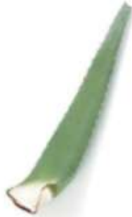
Aloe 蘆 lou4 薈 wai3