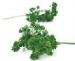
Parsley 番 faan1 荳 seoi1