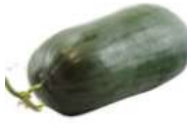
Wax gourd 冬 dung1 瓜 gwaa1

瓜 gwaa1、豆 dau6 及 kap6 其 kei4 他 taa1 蔬 so1 菜 coi3