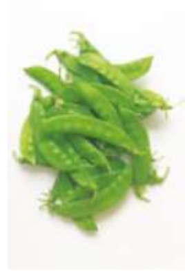
Garden pea 豌 wun1 豆 dau6 (another name 又稱： 荷 ho4 蘭 laan4 豆 dau6)