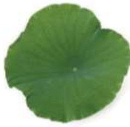
Lotus leaf 荷 ho4 葉 jip6