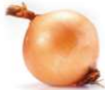
Onion 洋 joeng4 蔥 cung1