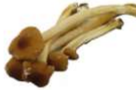
Tea tree mushroom 茶 caa4 樹 syu6 菇 gu1