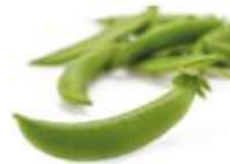
Sweet pea 甜 tim4 豆 dau6 (another name 又稱： 蜜 mat6 糖 tong4 豆 dau6)