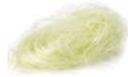
Corn silk 粟 suk1 米 mai5 鬚 sou1