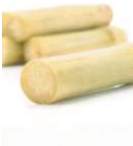
Sugar cane 竹 zuk1 蔗 ze3