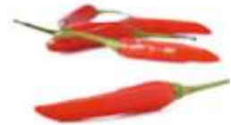
Chili pepper 指 zi2 天 tin1 椒 ziu1