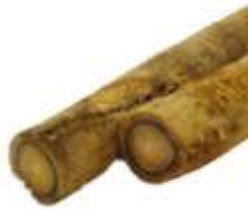
Burdock 牛 ngau4 蒟 bong2