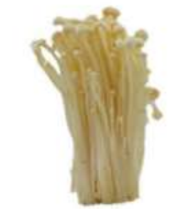
Needle mushroom 金 gam1 菇 gu1