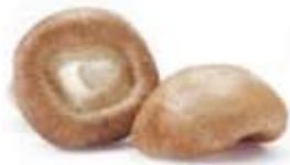
Fresh shiitake mushroom 鮮 sin1 冬 dung1 菇 gu1