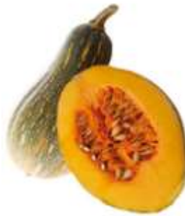
Pumpkin 南 naam4 瓜 gwaa1