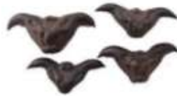
Water caltrop 菱 ling4 角 gok3