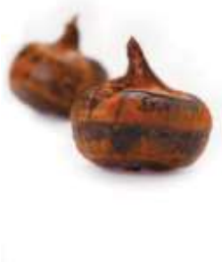
Water chestnuts 馬 maa5 蹄 tai4