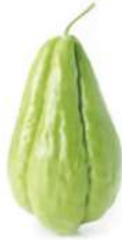
Chayote 佛 fat6 手 sau2 瓜 gwaa1 (another name 又稱： 合 hap6 掌 zoeng2 瓜 gwaa1)