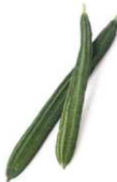
Angled luffa 絲 si1 瓜 gwaa1 (another name 又稱： 勝 sing3 瓜 gwaa1)