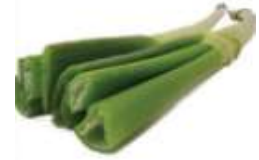
European leek 西 sai1 蒜 syun3