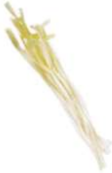
Blanching chive 韭 gau2 王 wong4