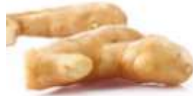
Ginger 薑 goeng1