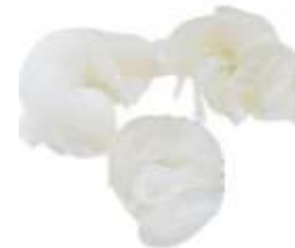
Konjac noodles 芋 wu6 絲 si1