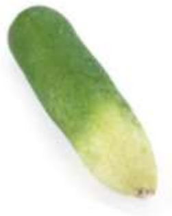
Green radish 青 ceng1 蘿 lo4 蔔 baak6 (another name 又稱： 青 ceng1 卜 baak6)