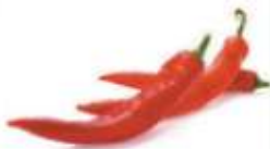
Red hot pepper 紅 hung4 尖 zim1 椒 ziu1