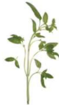
Basil 羅 lo4 勒 lak6 (another name 又稱： 九 gau2 層 cang4 塔 taap3)