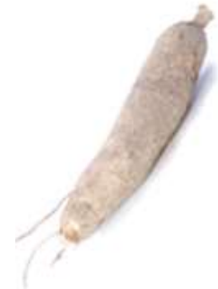
Cassava 木 muk6 薯 syu4