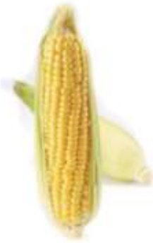
Corn 粟 suk1 米 mai5