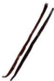
Vanilla 香 hoeng1 草 cou2 (another name 又稱： 雲 wan4 呢 nei1 拿 naa4)