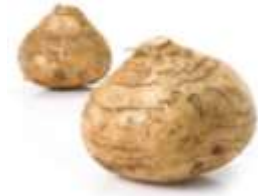
Yam bean 沙 saa1 葛 got3