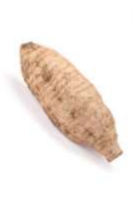
Kudzu 粉 fan2 葛 got3