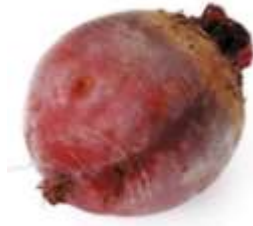
Beetroot 紅 hung4 菜 coi3 頭 tau4