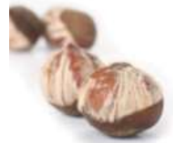
Chestnut 栗 leot6 子 zi2