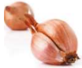
Shallot bulb 蔥 cung1 頭 tau4