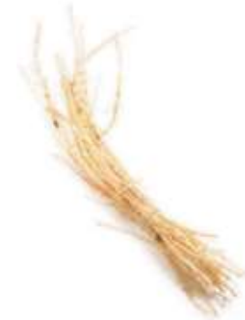
India Perotis 茅 maau4 根 gan1