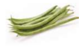
Snap bean 四 sei3 季 gwai3 豆 dau6