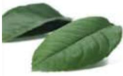
Lemon leaf 檸 ning4 檬 mung4 葉 jip6