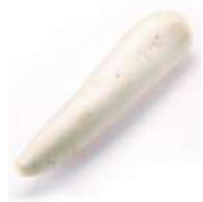
Radish 蘿 lo4 蔔 baak6 (another name 又稱： 白 baak6 蘿 lo4 蔔 baak6)

圖中為白蘿蔔 The picture shows as white radish