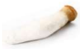
Shaggy mane 雞 gai1 腿 teoi2 菇 gu1 (another name 又稱： 雞 gai1 髒 bei2 菇 gu1)