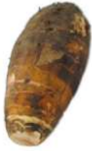
Taro 芋 wu6 頭 tau4