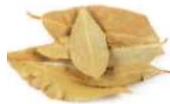
Bay leaf 月 jyut6 桂 gwai3 葉 jip6 (another name 又稱： 香 hoeng1 葉 jip6)