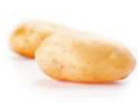
Potato 馬 maa5 鈴 ling4 薯 syu4 (another name 又稱： 薯 syu4 仔 zai2)