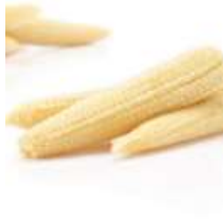
Baby corn 珍 zan1 珠 zyu1 筍 seon2 (another name 又稱： 玉 yuk6 米 mai5 筍 seon2 / 粟 suk1 米 mai5 仔 zai2)