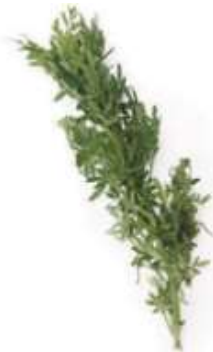
Common rue 臭 cau3 草 cou2