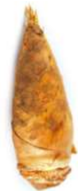
Bamboo shoot 竹 zuk1 筍 seon2