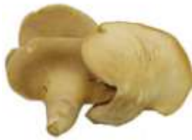
Abalone mushroom 鮑 baau6 魚 jyu4 菇 gu1