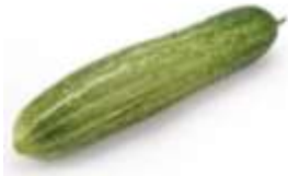
Zucchini 翠 ceoi3 玉 yuk6 瓜 gwaa1