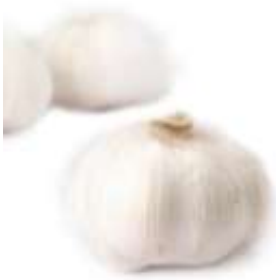
Garlic bulb 蒜 syun3 頭 tau4