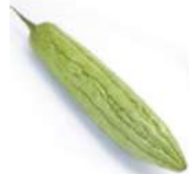
Bitter cucumber 苦 fu2 瓜 gwaa1 (another name 又稱： 涼 loeng4 瓜 gwaa1)