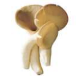
Small oyster mushroom 秀 sau3 珍 zan1 菇 gu1