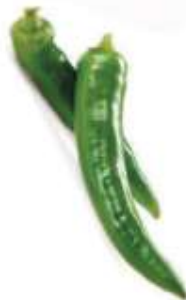
Green hot pepper 青 ceng1 尖 zim1 椒 ziu1