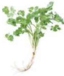
Chinese parsley 芫 jyun4 荳 sei1