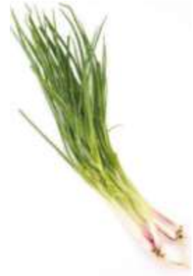
Spring onion 蔥 cung1