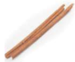
Cinnamon 肉 yuk6 桂 gwai3