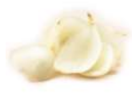
Lily bulb 百 baak3 合 hap6