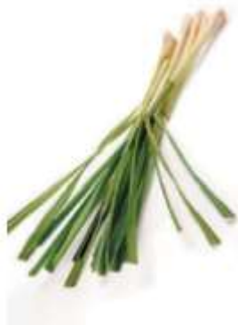
Lemon grass 香 hoeng1 茅 maau4