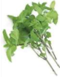
Mint leaf 薄 bok6 荷 ho4 葉 jip6