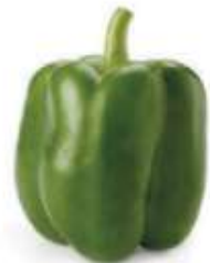
Sweet pepper 燈 dang1 籠 lung4 椒 ziu1