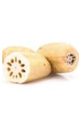
Lotus root 蓮 lin4 藕 ngau5