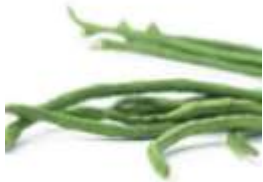
Yard-long bean 豆 dau6 角 gok3