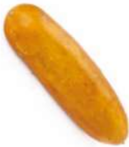
Yellow cucumber 老 lou5 黃 wong4 瓜 gwaa1