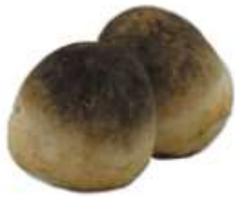
Straw mushroom 草 cou2 菇 gu1