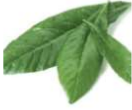
Loquat leaf 枇 pei4 杷 paa4 葉 jip6