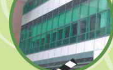
特大玻璃窗的環保設計