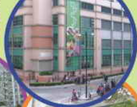
新界北區的聯和墟街市

有沒有想過在街市內經營服務行業呢？為配合現代社會對街市的多元化要求，以及增加在街市營運的行業種類，我們現正推行試驗計劃，希望在港島東區的西灣河街市、新界北區的聯和墟街市及屯門區的仁愛街市，引入服務行業（例如金融、美容、地產、旅遊、僱傭和家居服務等等）。如欲查詢詳情或索取更多資料，歡迎致電2867 5688或2867 5788與我們聯絡。