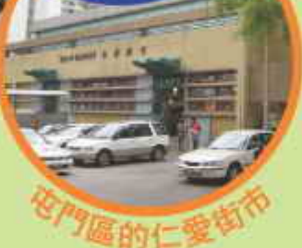
屯門區的仁愛街市