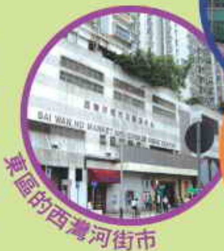
東區的西灣河街市