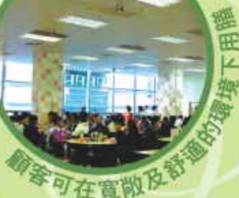
顧客可在寬敞及舒適的環境下用膳