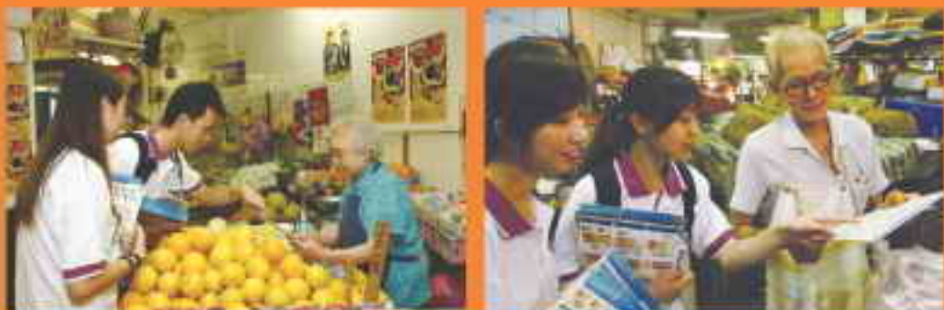
學生大使向街市商戶派發單張及座檯紙板，展示新鈔票的設計與新增的防偽特徵。

相信大家留意到，由本年十月開始，有三種面額(二十元、五十元及壹仟元)的全新設計港元鈔票於市面流通。香港金融管理局特別舉辦了一連串的教育活動，提高公眾對新鈔票防偽特徵的認識，其中包括於八月至十月期間委派學生大使到我們轄下各區主要的街市及熟食市場，向商戶派發附有新鈔票設計和關於新增防偽特徵的單張及座檯紙板。我們希望透過此類活動，為商戶提供更多實用的資訊。