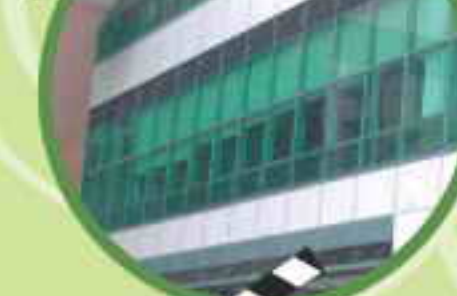
特大玻璃窗的環保設計

位於中西區的皇后街熟食市場已於本年十月一日正式啟用。部分熟食市場商戶提供特色潮州菜，而著名飲食專欄作家蔡瀾先生最近亦在其專欄中特別推介。此外，熟食市場亦提供其他港式美食，讓顧客有多元化的選擇。熟食市場的外觀設計新穎，設有空調系統，配合特大的環保玻璃窗，顧客可一邊舒適地用餐，一邊悠然欣賞窗外的景色。