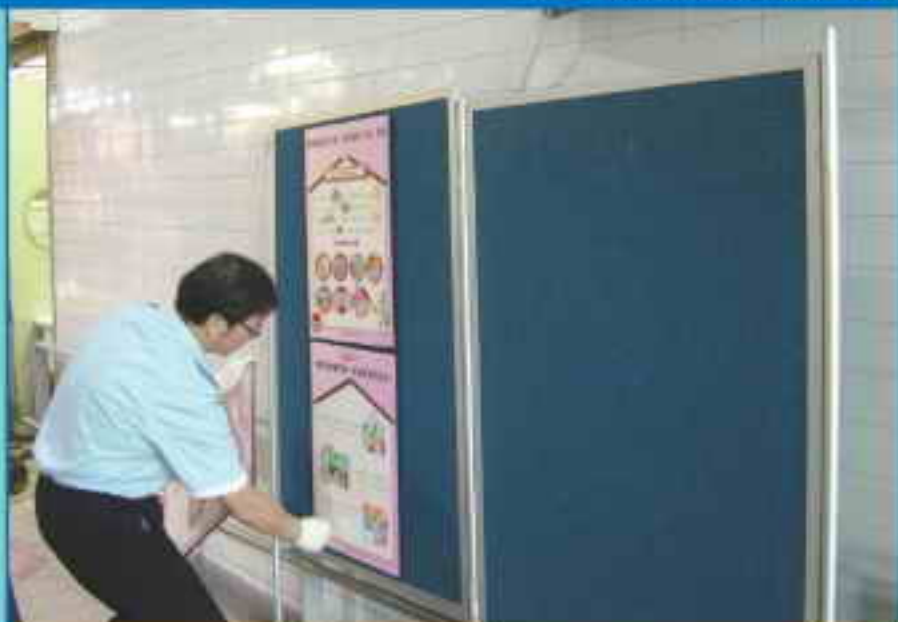
青衣街市組同事悉心安排展板的擺放位置，為市民提供資訊