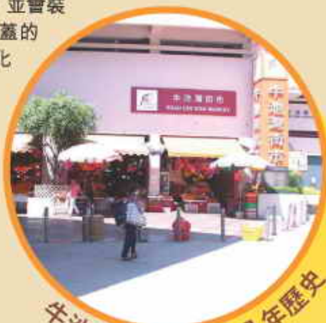
牛池灣街市已有十八年歷史

有關改善工程將於明年年初開始進行，為期大約一年。在工程進行期間，如果對各商戶和市民造成不便，希望各方面能夠體諒。我們期望改善工程能為這個已有十八年歷史的街市注入新的氣象，迎合社會大眾的要求。