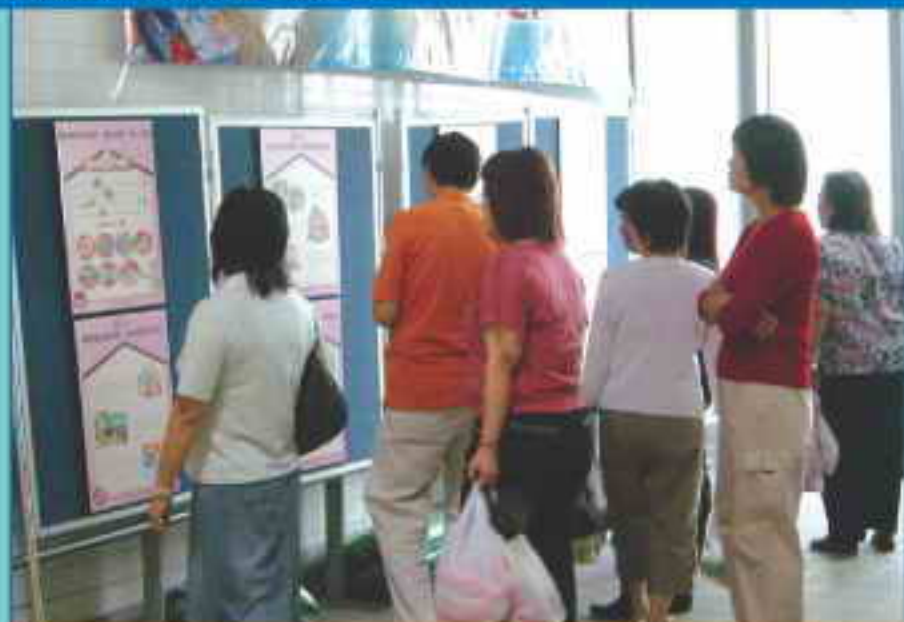
展板內容豐富實用，吸引不少市民前來參觀