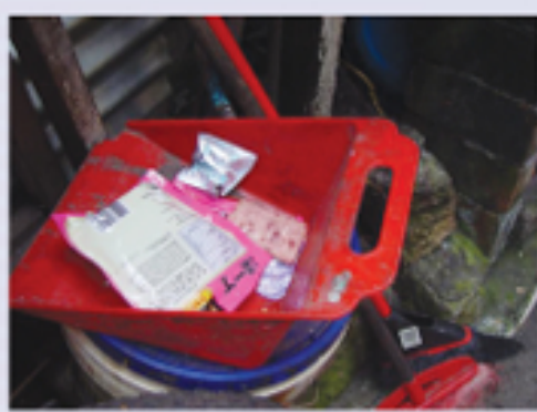
圖5.8(左) 及圖5.9(右) 處理不當的垃圾