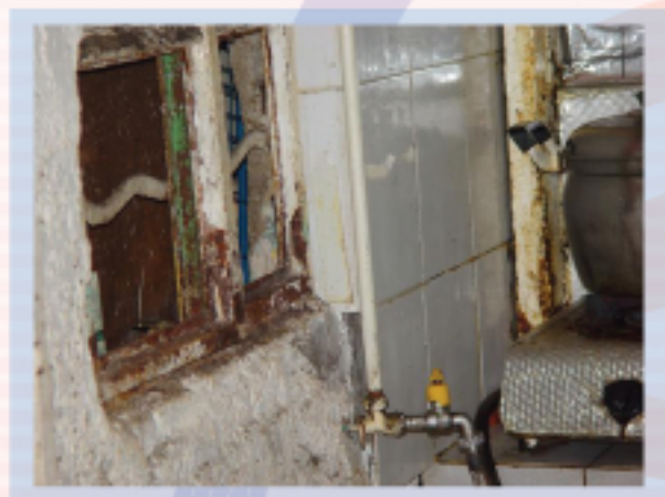
圖5.1破窗讓老鼠入屋為患