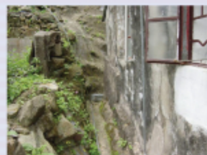
圖5.6居所附近的濃密草木