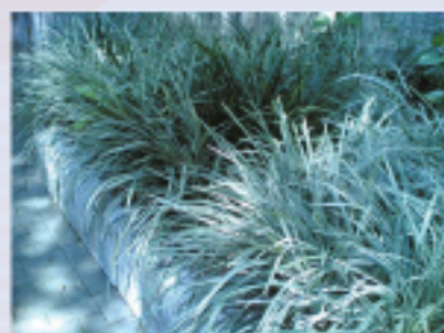
圖5.5草木濃密的花床

花床、花園及房舍附近的濃密草木有利老鼠藏匿，也令包括食物殘渣在內的垃圾無法徹底清理，成為老鼠的食糧。此外，花床及花園的草木如過於濃密，亦令鼠洞難以察覺。