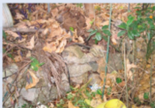
圖5.7花園內石塊間的縫隙

地上或其他搭建物的裂縫和罅隙為鼠隻提供即時的理想藏身之所。老鼠會以這些裂縫和罅隙為基地，挖掘四通八達的地道藏匿。