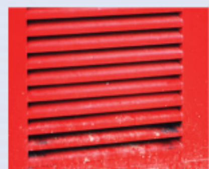
圖5.4通風氣窗為老鼠提供方便之門