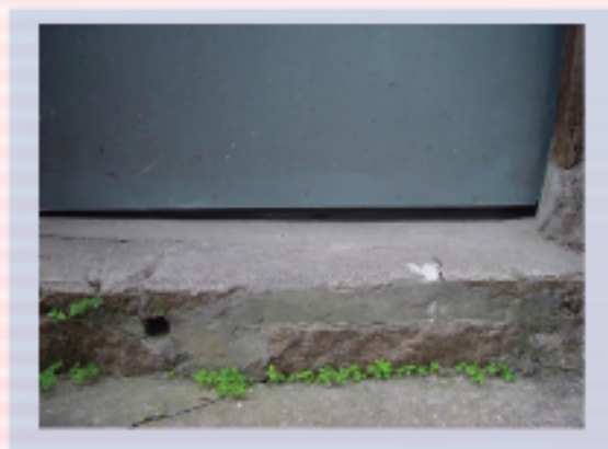
圖5.2超過6毫米的門腳離地空隙

老鼠可從門腳或間隔板/間隔牆離地的大空隙進入屋內。超過6毫米的空隙已可讓老鼠通過。