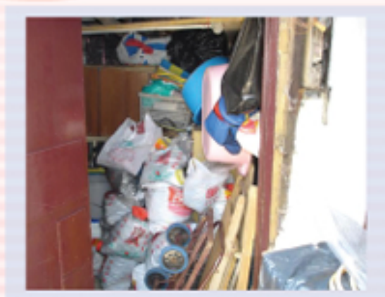
圖5.11(左) 及圖5.12(右) 堆積的雜物