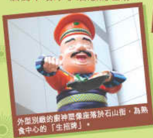
外型別緻的廚神塑像座落於石山街，為熟食中心的「生招牌」。

中西區的士美非路街市在本年初已完成了外牆翻新工程。位於士美非路地下的雲石外牆配上特大的宣傳燈箱，吸引途人目光；而石山街更加裝了大型廚神塑像，外型可愛，維妙維肖，令整個街市增添了活潑的色彩！