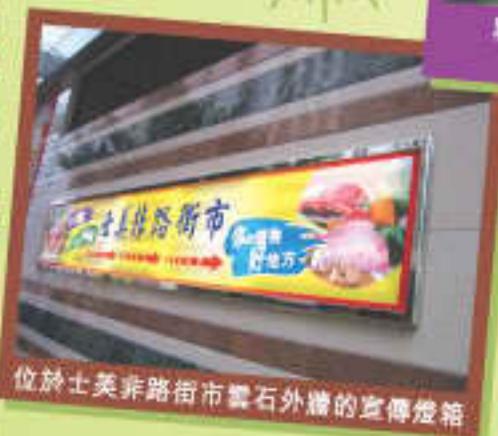
位於士美非路街市雲石外牆的宣傳燈箱