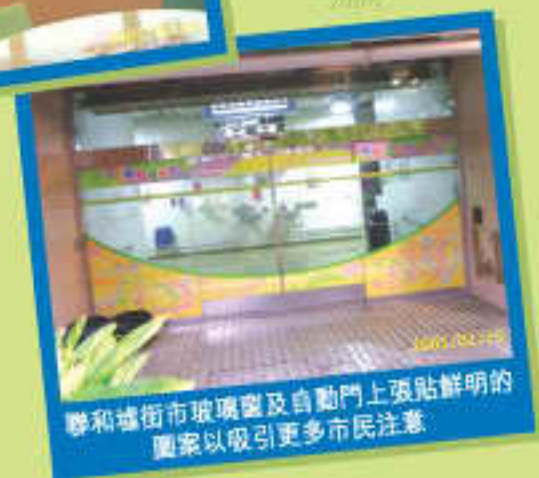
聯和墟街市玻璃窗及自動門上張貼鮮明的圖案以吸引更多市民注意

我們希望藉着這些美化項目，為街市建立一個更現代化的形象，讓顧客享受街市的購物樂趣。