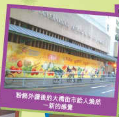
粉飾外牆後的大橋街市給人煥然一新的感覺