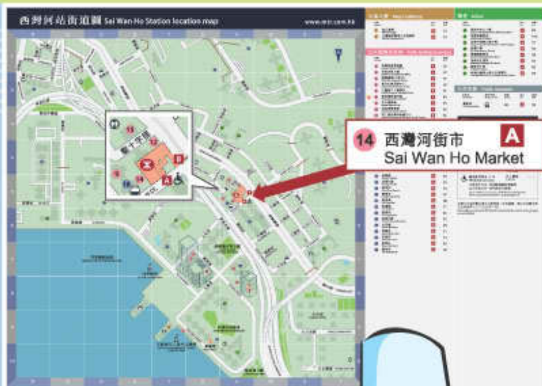
14 西灣河街市 Sai Wan Ho Market

為了使市民更方便得知街市的位置，我們與地鐵公司協商將街市名稱顯示於地鐵車站街道圖上，並於本年一月開始，陸續在港島線、觀塘線、荃灣線、將軍澳線至東涌線相關的車站街道圖加上街市名稱。大家不妨在下次乘坐地鐵時看一看吧！