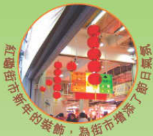
紅磡街市新年的裝飾，為街市增添了節日氣氛